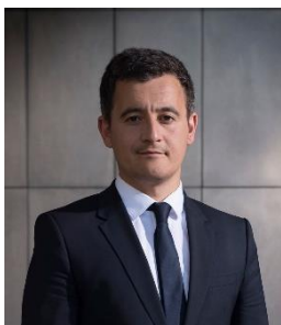
Gérald DARMANIN Ministre de l'Action et des Comptes publics

Depuis plus de deux ans et demi, le contrôle fiscal a engagé une transformation en profondeur de son organisation, de ses outils et de ses méthodes.