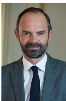
Édouard Philippe Premier Ministre

Le principe d'une contribution commune à l'entretien des services publics est un des fondements de notre pacte républicain. Il figure dans le texte de la déclaration des droits de l'Homme et du Citoyen, qui précise que cette contribution doit peser de façon égale sur tous les citoyens.