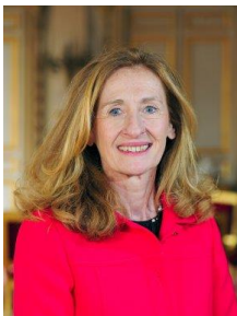
Nicole Belloubet Ministre de la Justice

La fraude fiscale cause un grave préjudice moral et financier à la société car elle remet en cause deux principes qui sont au cœur du pacte républicain : l'égalité devant l'impôt et le consentement à l'impôt.